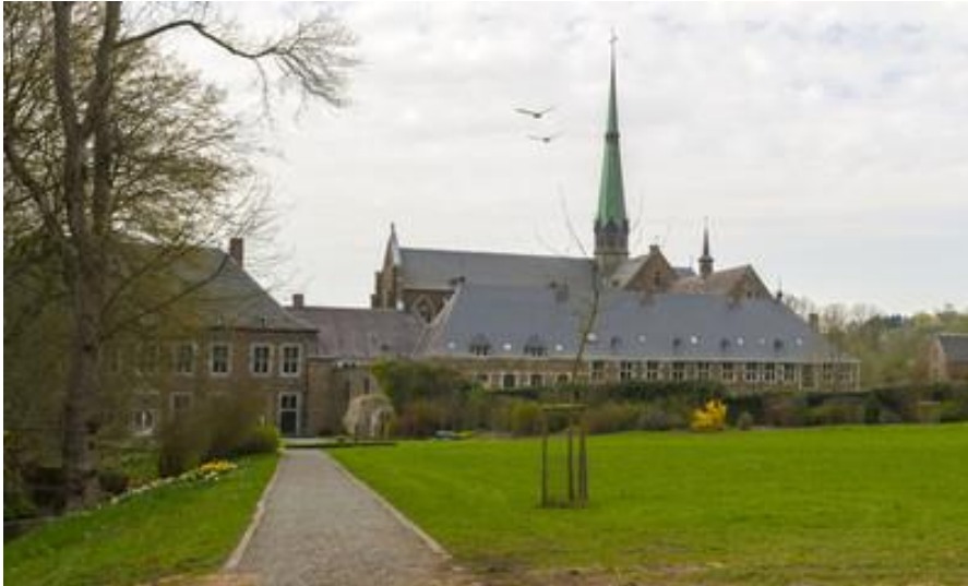
Kloster Val Dieu