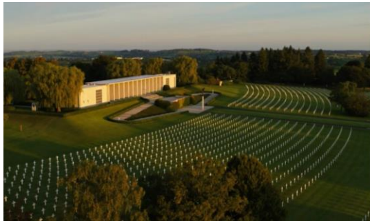
US Soldatenfriedhof Henri Chapelle