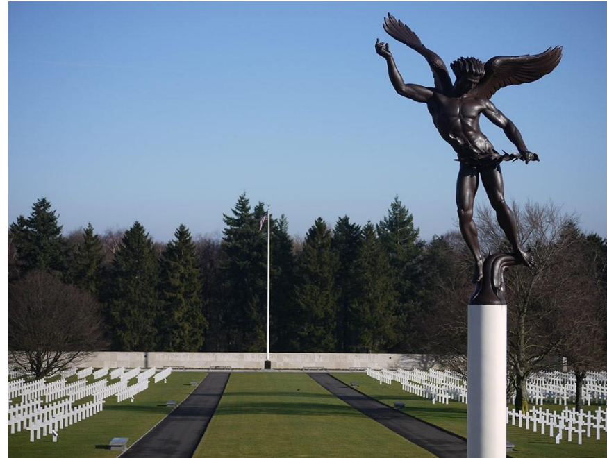
US Soldaten Friedhof Henri-Chapelle

Kosten: Die Teilnahme an der Rundfahrt inkl. Abendessen war kostenfrei