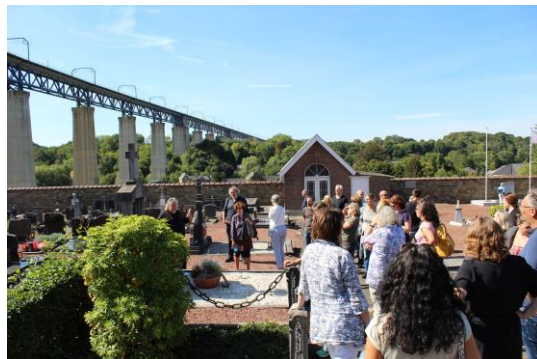
Gemeindefriedhof Moresnet